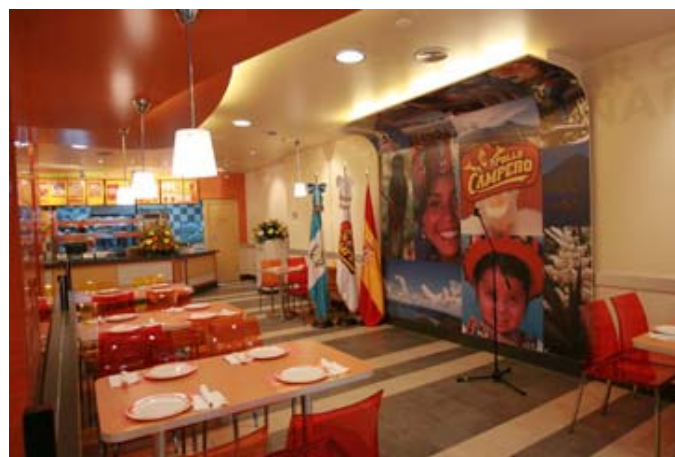
Vista del restaurante Pollo Campero, en la C/ Fuencarral Nº 103, de Madrid.

En esta oportunidad se ha vuelto a apostar por una oferta combinada de la mano de Telepizza cuyos productos se suman a la rica oferta de Campero.